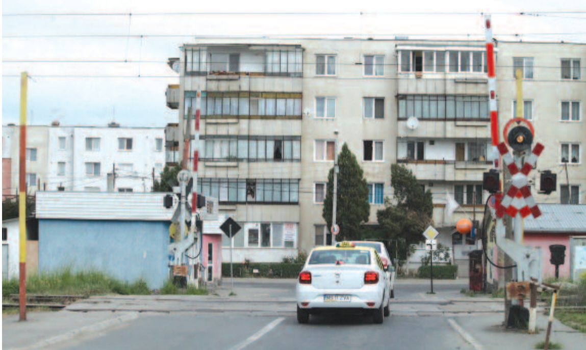
Megszüntetik a vasúti átjárót

A másik szakaszon az örökségvédelmi intézet készíti a tanulmányokat, arra mi nem tudunk külön dokumentációt rendelni.