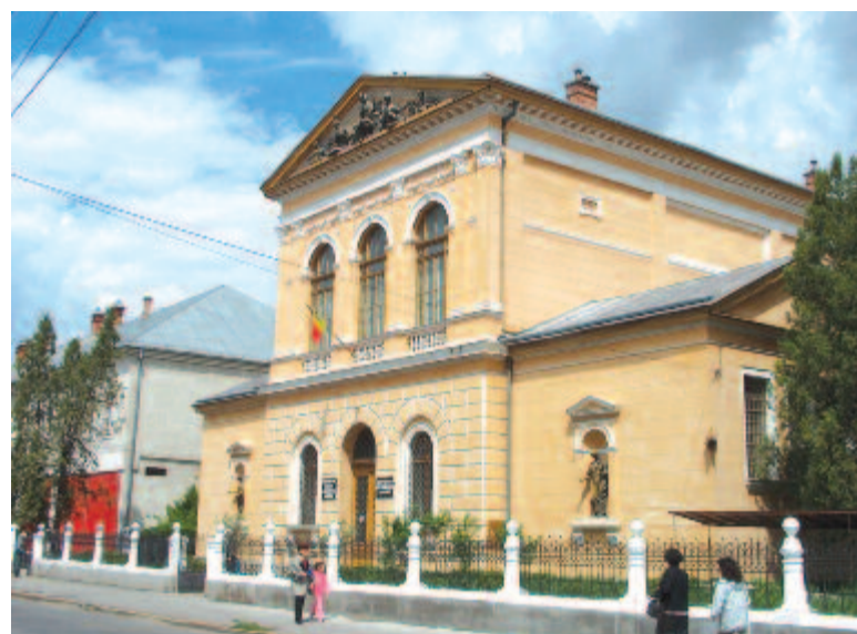
A természettudományi múzeum