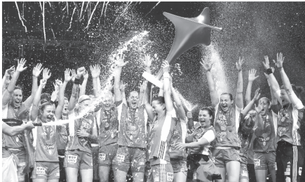
A győztes Győri Audi ETO csapata a női kézilabda Bajnokok Ligája eredményhirdetésén

* elődöntők (szombaton játszották): Győri Audi ETO KC – Bukaresti CSM 26-20 (12-10), Vardar Szkopje – Rosztov-Don 25-19 (10-7)